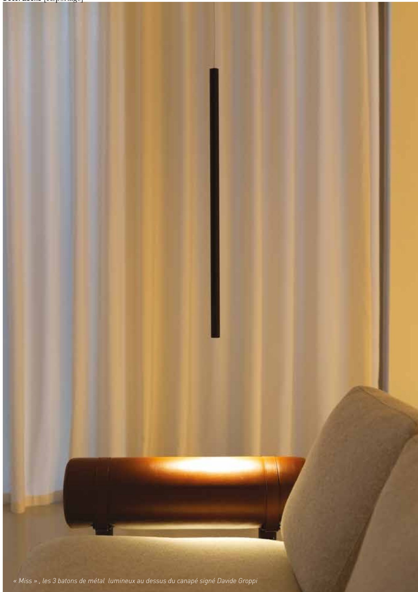
« Miss », les 3 batons de métal lumineux au dessus du canapé signé Davide Groppi