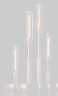
Lampada da tavolo portatile e ricaricabile, in vetro e metallo, disegnata da Yoshiki Matsuyama, Barcarolle di Ambientec. ambientec.co.jp