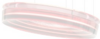
Sospensione a disco realizzata in lucite e resina, disegnata e autoprodotta da Draga & Aurel, Phebe di Draga & Aurel. draga-aurel.com