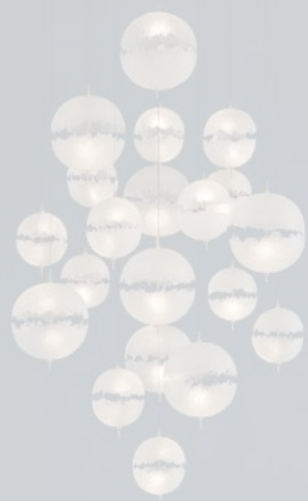
Chandelier con struttura in metallo e diffusori realizzati in fiberglass dall'effetto sfrangiato, PostKrisi di Catellani&Smith. catellanismith.com