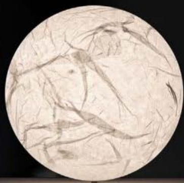
Lampada da tavolo a forma sferica in carta giapponese realizzata a mano con base in metallo, Moon T di Davide Groppi. davidegropi.com