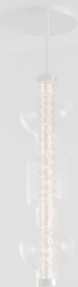
Lampada in vetro zigrinato con corpo luminoso in alluminio, disegnata da Neil Poulton, Alambicco di Artemide. artemide.com