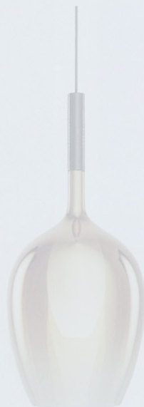
DESIGN Danilo De Rossi

Sospensione in vetro metallizzato ramato (nella foto), titanio o verde acqua. La struttura è in 3 colori, qui canna di fucile.