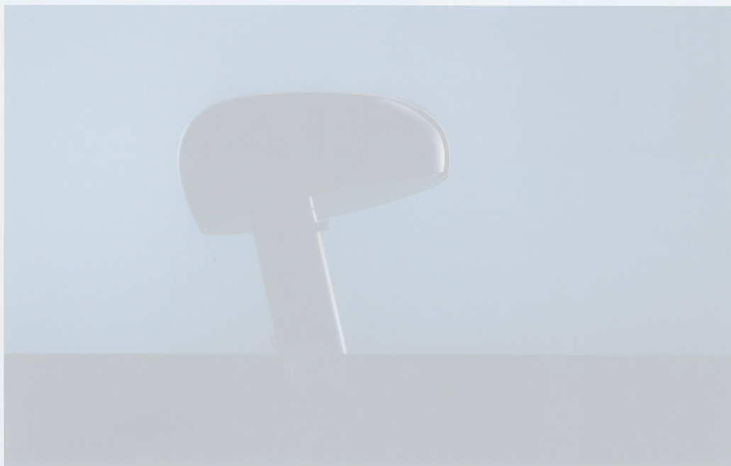
DESIGN Achille e Pier Giacomo Castiglioni

Nasce dallo studio della corretta forma di una lampada da lettura, con gli elementi impilati però fuori asse per avere una luce diretta senza ostacoli, ma il riflettore a forma di muso di bracchetto l'ha resa un oggetto senza tempo. Ora il navy blue si aggiunge ad arancio, nero e verde.