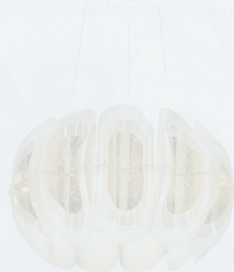
DESIGN Paolo D'Arrigo

Una scultura di luce organica celebra i 30 anni del brand. In strati di Opaflex, Lentiflex e foil metalizzato, nei colori white, gold, silver.