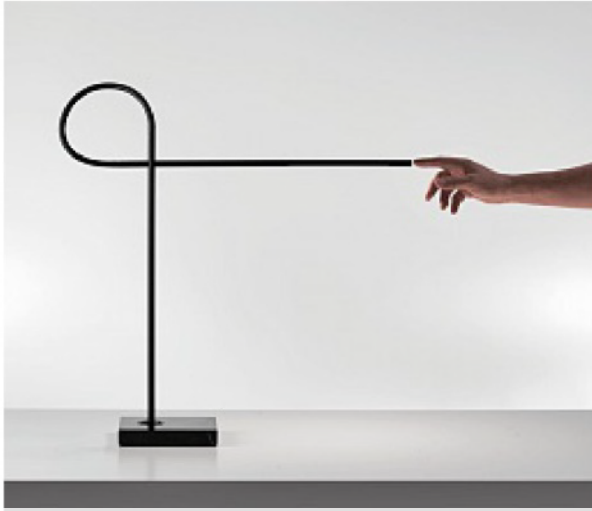
DAVIDE GROPPI, RIBBON, DESIGN MAURICI GINÉS Lampada da tavolo composta da due bracci di alluminio verniciato nero opaco collegati da un tubo di silicone nero. Lo snodo permette la rotazione lungo l'asse verticale, la luce è anche orientabile intorno alla base in marmo nero. Cm 17,5-62×15×64 h. ● Table lamp made up of two matt black-painted aluminium arms connected by a black silicone tube. The joint allows rotation along the vertical axis; the light can also be directed around the black marble base. 17.5-62×15 cm, height 64 cm. davidegroppi.com