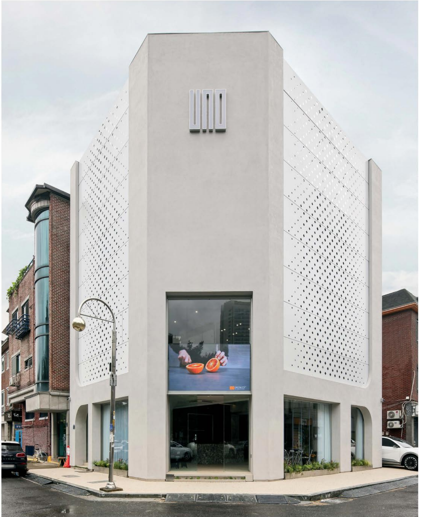
(주)마춤가구 우노 쇼룸 : 경기도 성남시 분당구 황새울로116번길 4 | 0507-1478-6776