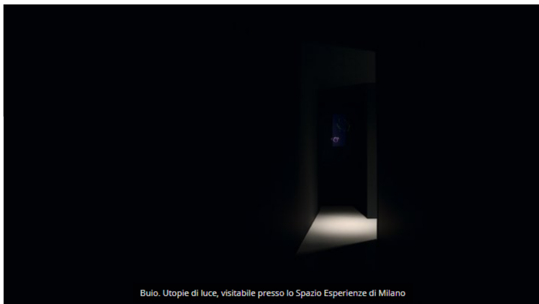
Buio. Utopie di luce, visibile presso lo Spazio Esperienze di Milano

Davide Groppi stupisce nuovamente con un'inedita riflessione sul mondo dell'illuminazione, in equilibrio tra arte e tecnologia. Ispirato dai grandi Maestri del '900, Davide in persona si è ri-avvicinato alla tecnica del ready made – con cui aveva iniziato a creare negli Anni '80, ancora ragazzo, i primi prototipi nel suo piccolo laboratorio di Piacenza – dando vita alle installazioni della mostra Buio. Utopie di luce , visibile presso lo Spazio Esperienze di Milano, in via Medici 13 , fino al 10 settembre.